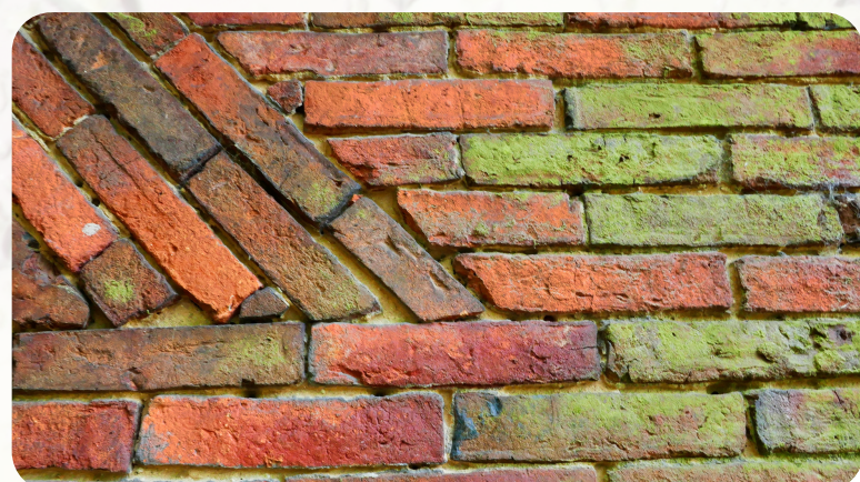
Fliser & murværk